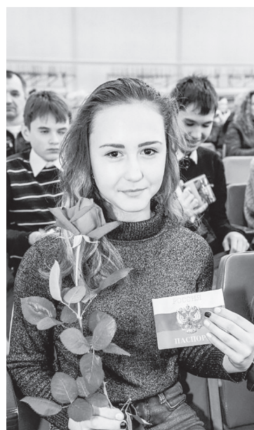
Бесценный документ получен, теперь главное — оправдать высокое звание

ПОД ТАКИМ ДЕВИЗОМ В НИЖНЕТУРИНСКОМ ГОРОДСКОМ ОКРУГЕ 14 ИЮНЯ ПРОШЛО ТОРЖЕСТВЕННОЕ МЕРОПРИЯТИЕ ПО ВРУЧЕНИЮ ПАСПОРТОВ НЕСОВЕРШЕННОЛЕТНИМ, ДОСТИГШИМ ЧЕТЫРНАДЦАТИЛЕТНЕГО ВОЗРАСТА.