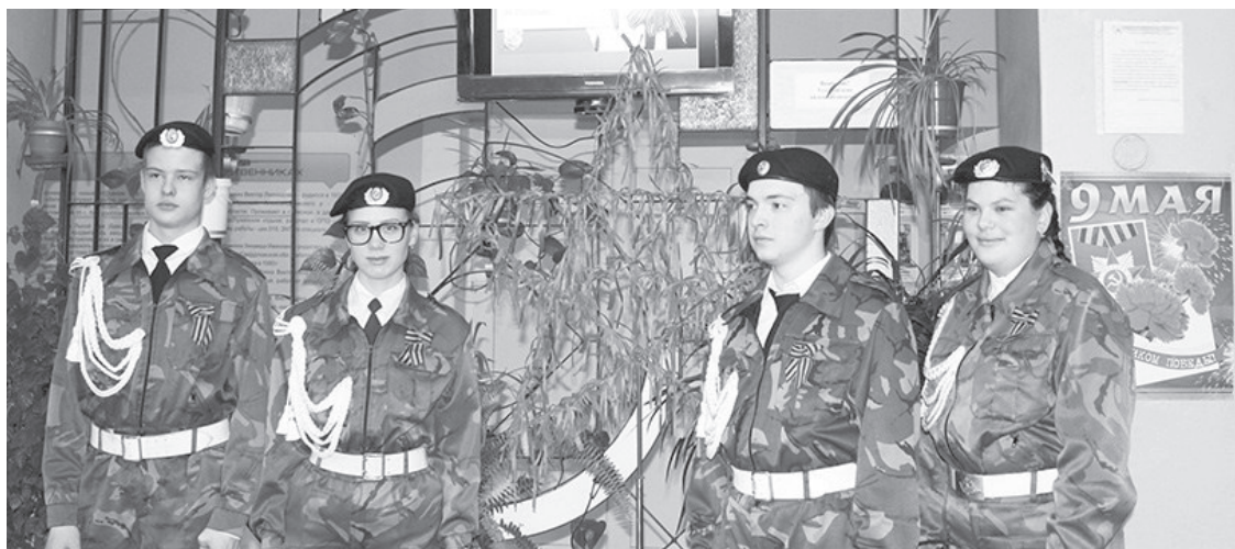
В техникуме проходит акция «Звезда памяти и Георгиевская ленточка»