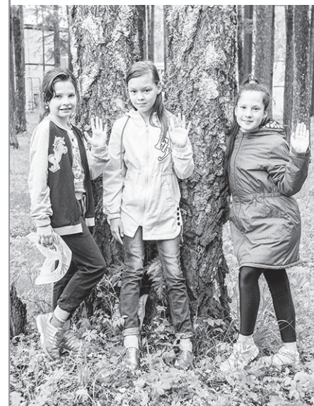
Привет всем из «Ельничного»! Хорошо живётся здесь!

У нас проходит много разных презентаций. Так, недавно состоялась презентация ракет, макеты которых