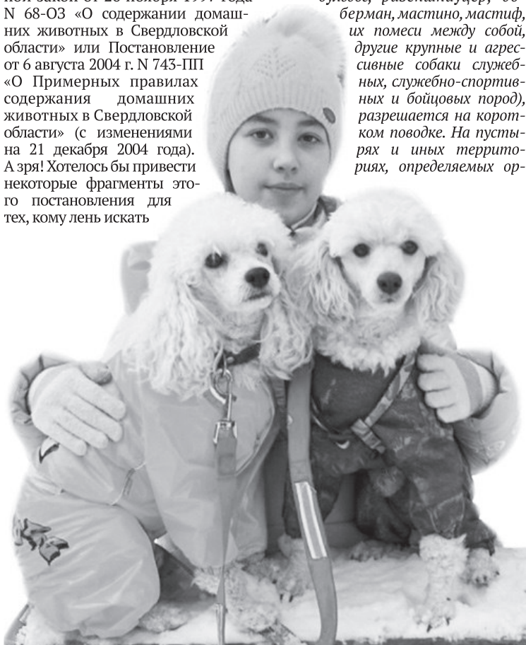
Пудели со своей хозяйкой

79. Выгул собак, требующих особого внимания владельца (породы собак, требующие особого внимания владельца: бультерьер, американский стаффордширский терьер, ротвейлер, чёрный терьер, кавказская овчарка, южнорусская овчарка, среднеазиатская овчарка, немецкая овчарка, московская сторожевая, дог, бульдог, ризеншнауцер, доberman, мастино, мастиф, их помеси между собой, другие крупные и агрессивные собаки служебных, служебно-спортивных и бойцовых пород), разрешается на коротком поводке. На пустырях и иных территориях, определяемых ор-