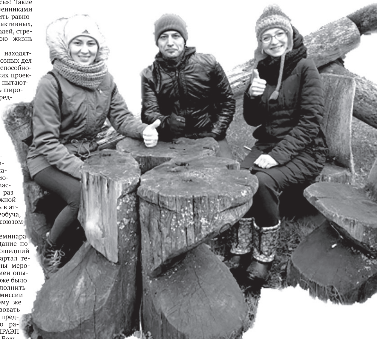
Молодёжь ПК-391 во время семинара РПРАЭП, г. Челябинск

Н. МУХИНА, ПК-391 г. Лесной