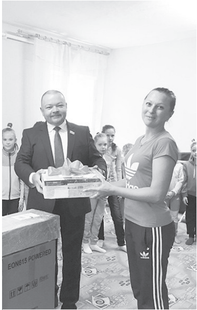
Момент вручения звукопроигрывающей аппаратуры гимнасткам ДЮСШ «Олимп»