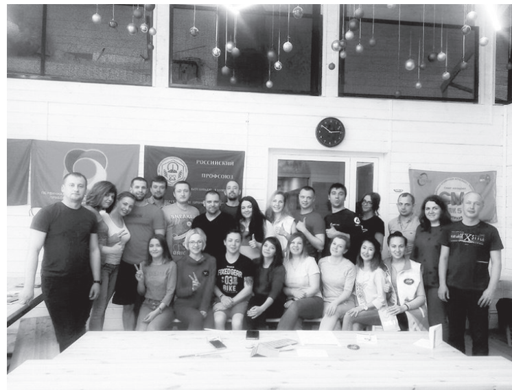
Итоговое фото всех участников семинара