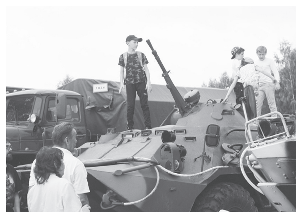
Выставка военной техники вызвала большой интерес