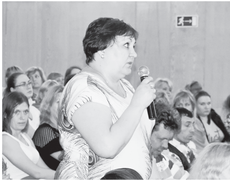
Дискуссия во время собрания профактива

ВОЛНА ПРОТЕСТА, СВЯЗАННАЯ С НЕОЖИДАННЫМ ВНЕСЕНИЕМ ПРАВИТЕЛЬСТВОМ РФ НА РАССМОТРЕНИЕ ГОСУДАРСТВЕННОЙ ДУМЫ ЗАКОНОПРОЕКТА О ПОВЫШЕНИИ ПЕНСИОННОГО ВОЗРАСТА, ПРОДОЛЖАЕТ РАСПРОСТРАНЯТЬСЯ ПО СТРАНЕ. ИНТЕРНЕТ ЗАПОЛНИЛА ИНФОРМАЦИЯ О МАССОВОМ НЕСОГЛАСИИ ЛЮДЕЙ РАЗНЫХ ВОЗРАСТНЫХ КАТЕГОРИЙ С ПОВЫШЕНИЕМ ПЕНСИОННОГО ВОЗРАСТА. МНОГИЕ ПРОФСОЮЗНЫЕ ПЕРВИЧНЫЕ ОРГАНИЗАЦИИ ПРЕДПРИЯТИЙ ГОРОДОВ СВЕРДЛОВСКОЙ ОБЛАСТИ ПРОВОДЯТ СОБРАНИЯ В ПОДДЕРЖКУ ПОЗИЦИИ ФЕДЕРАЦИИ НЕЗАВИСИМЫХ ПРОФСОЮЗОВ И РОССИЙСКОГО ПРОФСОЮЗА РАБОТНИКОВ АТОМНОЙ ОТРАСЛИ.