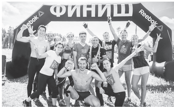
Лесничане, участники гонки «Стань человеком»

День старта 7.07.2018. Погода очень порадовала, хотя накануне обещали дождь. Прибыли к месту старта, сразу было заметно, что всё подготовлено к соревнованиям на высоком уровне, организаторам