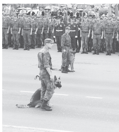
Выступают кинологи в/ч 3275 и их служебные собаки

Затем вниманию многочисленных зрителей было представлено выступление военнослужащих кинологической службы и их умных четвероногих воспитанников, готовых выполнять поставленные боевые и служебные задачи со стопроцентной отдачей и максимальной