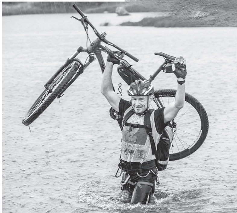
На этапе «Брод»

Соревнования по экстремальному туризму проводятся в течение 24 часов на дистанции протяжённостью 100 км и разбиты на три тура с двумя принудительными перерывами между ними по 3-4 часа для отдыха спортсменов. В каждом туре участники проходят по несколько разных этапов. Это и скалолазание, и сплав на катамаранах, и гонки на велосипедах по пересечённой местности и бездорожью, и транспортировка «пострадавшего» на носилках, переправы через речки вброд и по натянутым верёвкам. В общем, разнообразных этапов было много, а точнее — 21. Все чрезвычайно сложные, и без соответствующей подготовки пройти их было нелегко. Перед стартом основных состязаний на поляне проходили специальные этапы, которые были ориентированы на спортивный туризм: констест, скалолазание на скалодроме и конкурсы художественной самодеятельности.