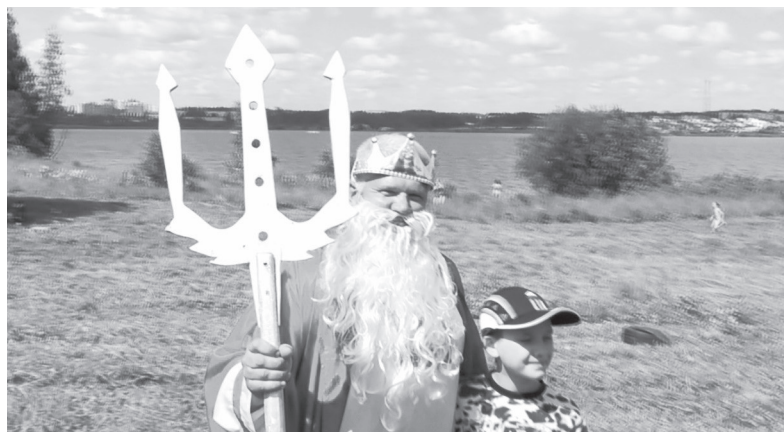
Фотосессия с Нептуном