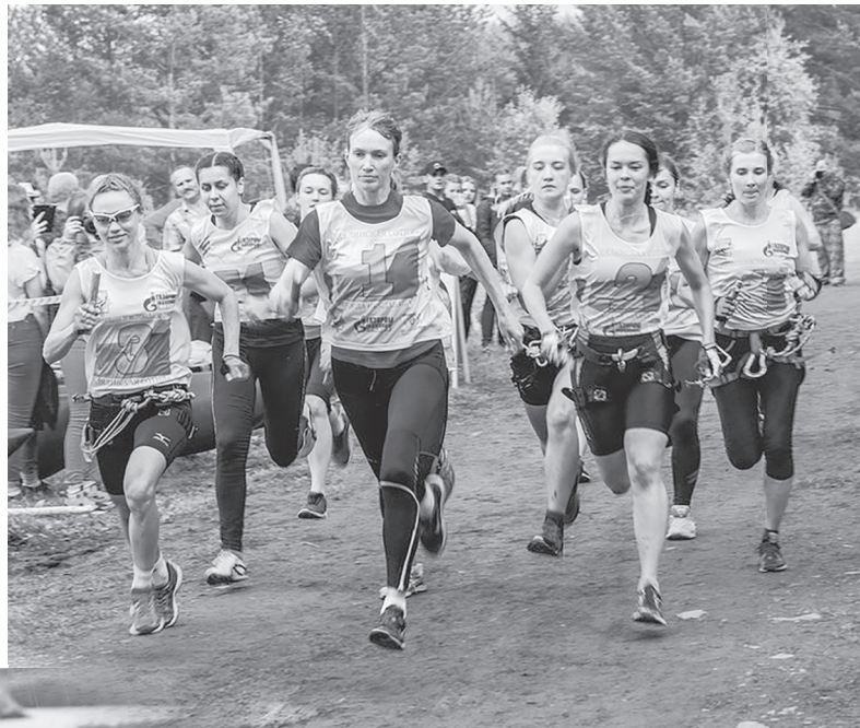
Старт «Лялинской сотни»

«Никогда не сдавайся!» — главный девиз её участников