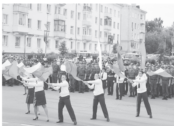
Росгвардия - это сила и мощь государства