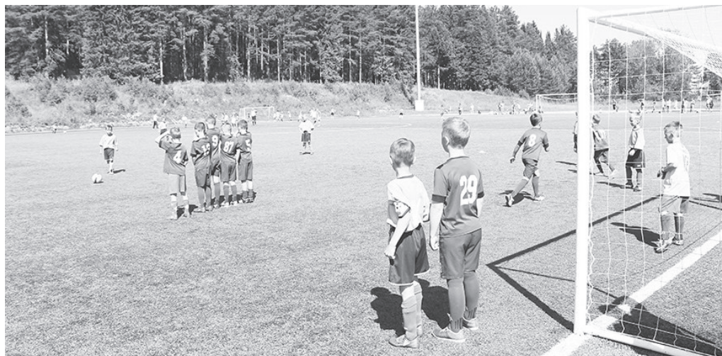
«Старт» бьёт штрафной в ворота «Маяка»