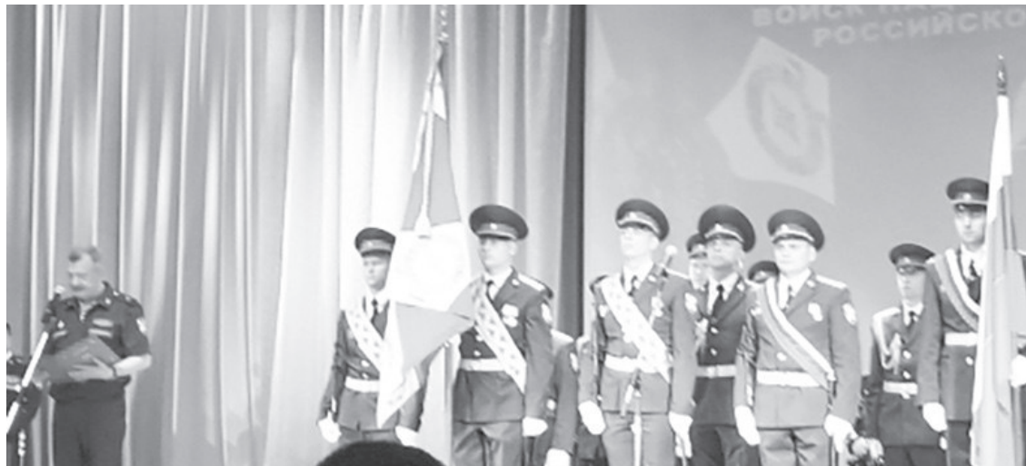
Один из торжественных моментов праздничного вечера

Нижнетуринский городской округ также тесно сотрудничает с войсковой частью 3275. Это и многочисленные совместные мероприятия, «Уроки мужества» в школах