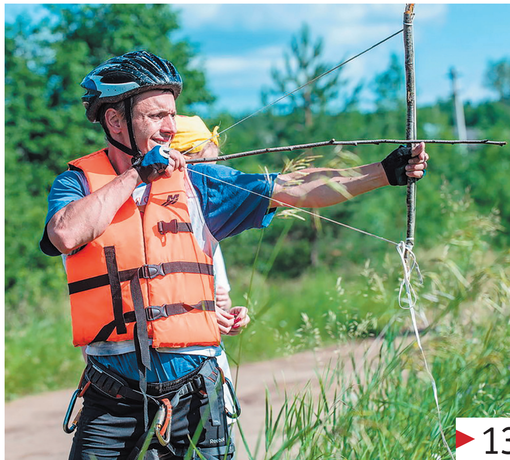
На этапе «Стрельба из самодельного лука по мишеням».