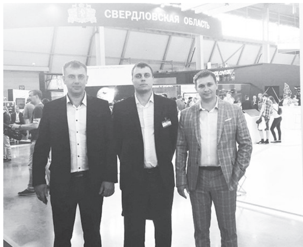
Делегация из Нижней Туры на ярмарке промышленной техники, оборудования и услуг «ИННОПРОМ-2018»