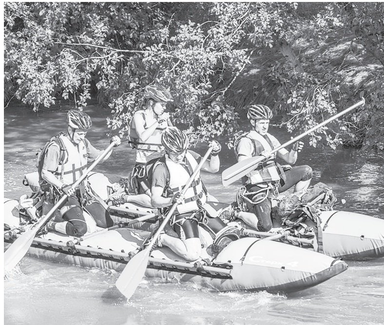
Водный «слалом» на бурной реке