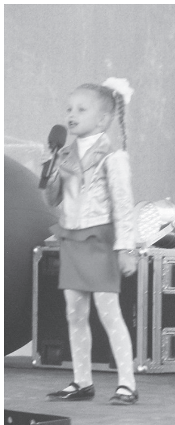
Среди выступавших на праздничном вечере были и юные вокалисты Лесного

Н. КОЛПАКОВА, редактор отдела культуры г. Лесной