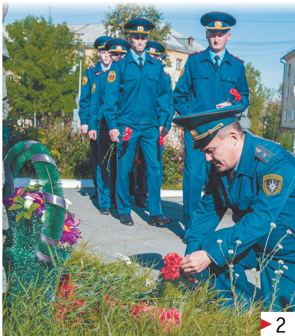
Сотрудники СУ ФПС № 6 почтили память коллег, погибших в противостоянии терроризму.