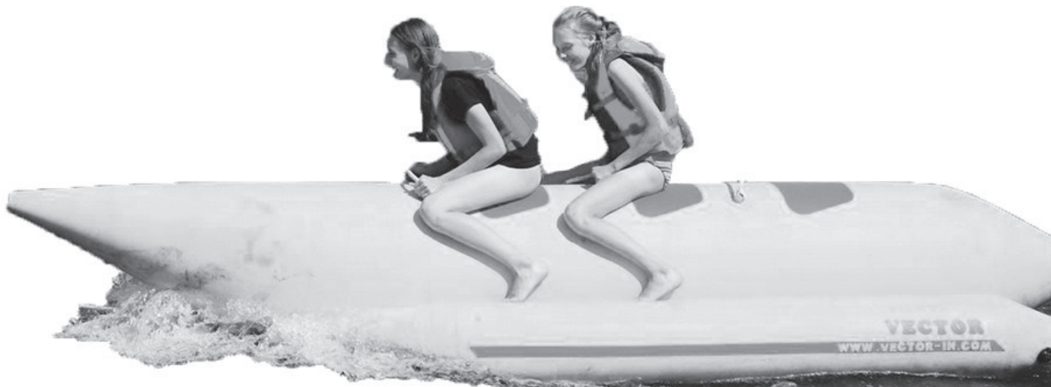
Весёлый отдых на озере Таватуй

фортного времяпрепровождения. Администрация базы предоставляет мангалы для барбекю и возможность приобрести уголь для костра, бесплатно для работников комбината — охраняемую автостоянку. Большинство домиков расположены непосредствен-