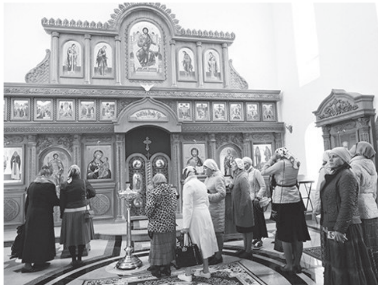
В женском монастыре преподобномученицы Елизаветы

17 паломников увидели старинные городские здания и сооружения бывшего железодобывающего завода. Они побывали и в великолепном Свято-Троицком соборе, который был построен в 1702 году. Он знаменит своими святынями: образом Божией Матери «Августовская» (икона написана в честь явления Божией Матери в 1914 году русским солдатам), мощами преподобномученицы Елизаветы Фёдоровны и святых земли русской, склепом, где пребывали гробы с телами Великокняжеских мучеников семьи Романовых после их поднятия из шахты в 1918 году. Паломники стали свидетеля-