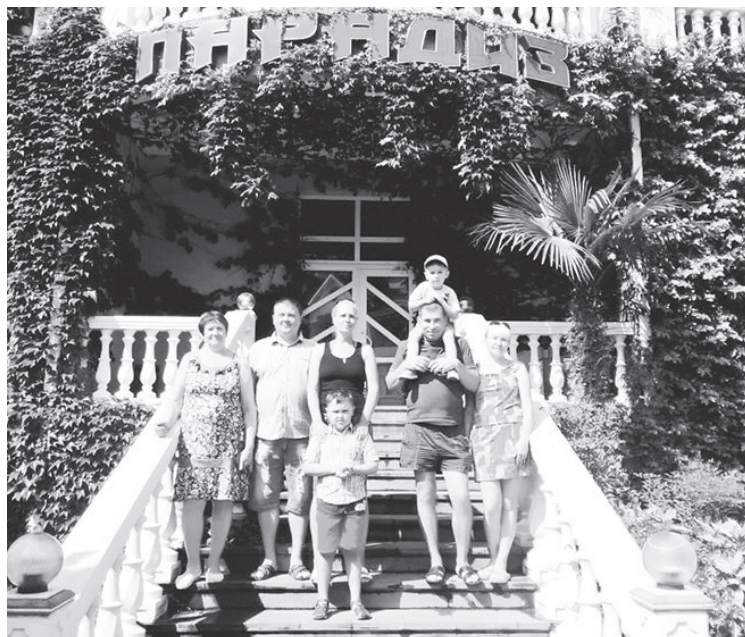
Счастливые отпускники в Адлере

Н. МУХИНА, ПК-391 г. Лесной