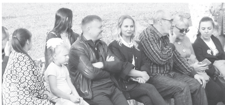
В парк пришли не только дети, но их родители, бабушки и дедушки

Да, пришёл новый учебный год, и надо достойно попрощаться с каникулярным летом, проводить его радостно и без сожаления. И ребятам в этом помогли сотрудники и артисты СКДЦ «Современник», парка. К ним присоединились хореографические, вокальные и даже цирковые коллективы юных: полюбившийся уже всем