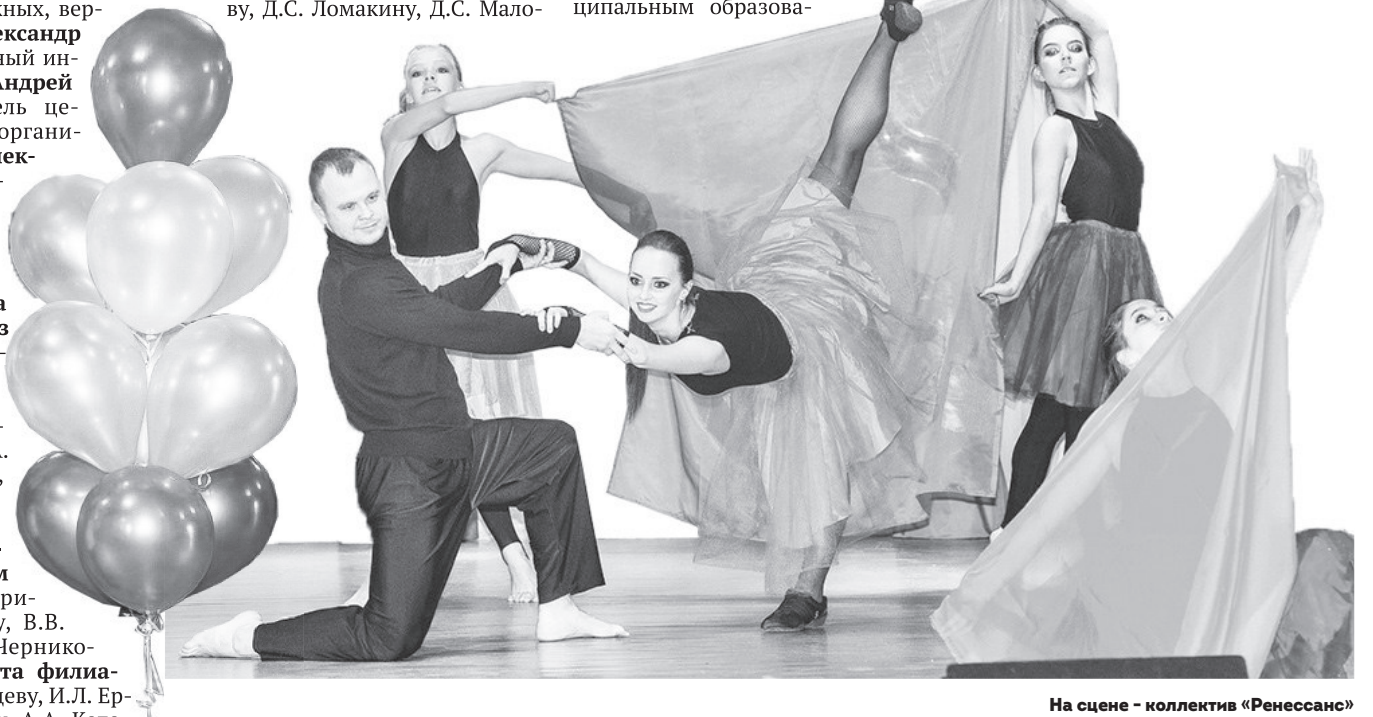
На сцене — коллектив «Ренессанс»