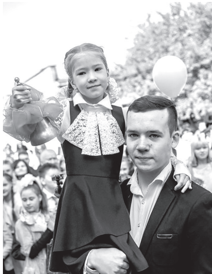
Первый звонок нового учебного года