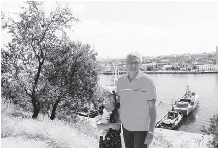
И Крым активно осваивают отдыхающие комбината «ЭХП»