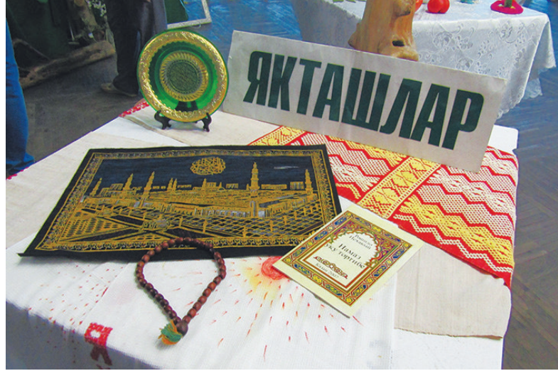
Один из выставочных столов «Якташлара»

Букет был оживлён божественным дыханьем И сердце наполнял святым очарованьем