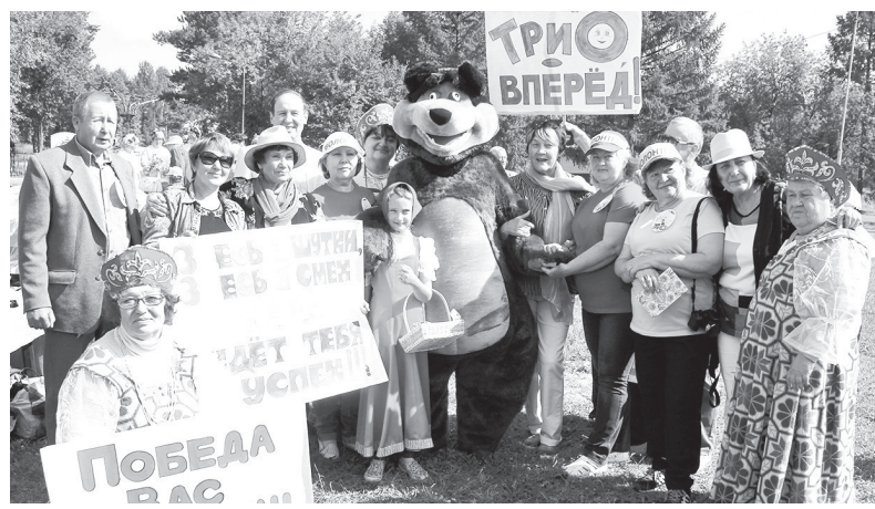
Зажигательная «Три О» — сборная ОВД, ОРСа и управления образования — на городском туристическом слёте пенсионеров, г. Лесной, 2018 г.

После праздника ветераны отправились на озеленение территории, где трудились с большим удовольствием. Совместно с сотрудни-