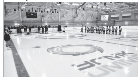
Новая ледовая арена, открывшаяся в Красноуральске, получила название «Молодость».

В КРАСНОУРАЛЬСКЕ 1 сентября открылась новая ледовая арена, получившая название «Молодость».