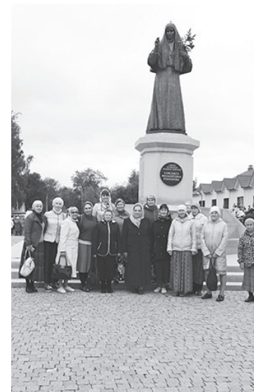
У памятника святой преподобномученицы Елизаветы

ми торжества и красоты Елизаветинского бала, ежегодно устраиваемого на площади, рядом с возведённым памятником Великой княгине Елизавете.