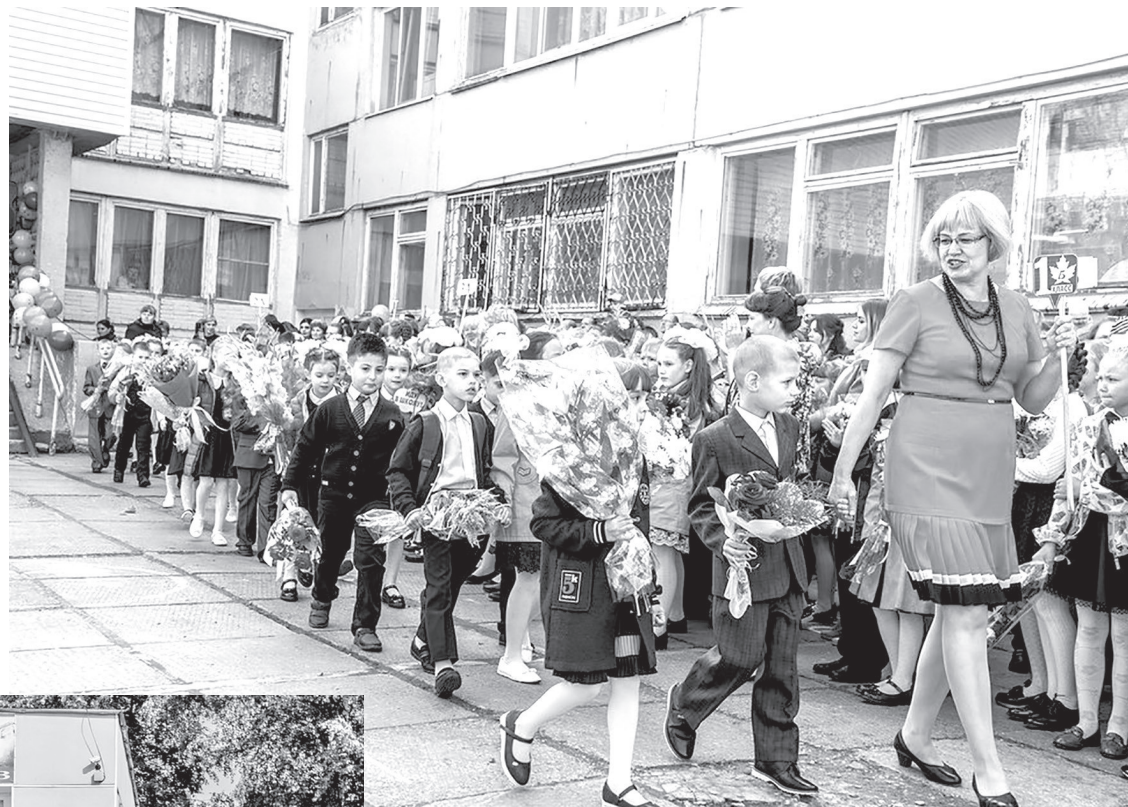
Первоклассники СОШ № 7: вместе в новую жизнь

вали в спортивных мероприятиях, поиграли в интересные командные игры и проявили себя во многих областях знаний — всего была организована работа двадцати пяти площадок: «Дорогой добрых дел», «Мы — вместе! Нам здорово!», «Наука для жизни», «Вместе мы сила», «Искусство вдохновлять», «О тех, кто любит нас больше, чем себя», «STARTech — первый шаг в Индустрию 4.0.» и других. Восторг мальчишек и девчо-