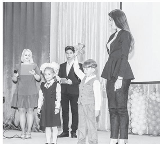
Звонко звучит школьный звонок, старт новому учебному году дан!