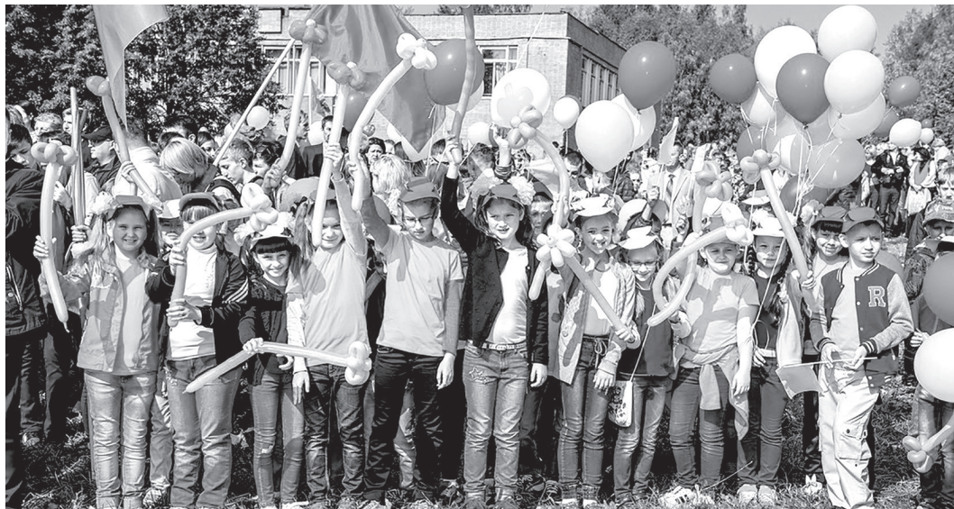
Юные лесничане готовы делать мир ярче!

УТРОМ 1 СЕНТЯБРЯ ДЛЯ ШКОЛЬНИКОВ ЛЕСНОГО И НИЖНЕЙ ТУРЫ ПРОЗВЕНЕЛ ПЕРВЫЙ ЗВОНК НОВОГО УЧЕБНОГО ГОДА. ТОРЖЕСТВЕННЫЕ ЛИНЕЙКИ ПРОШЛИ ВО ВСЕХ ОБЩЕОБРАЗОВАТЕЛЬНЫХ УЧРЕЖДЕНИЯХ НАШИХ ГОРОДОВ.