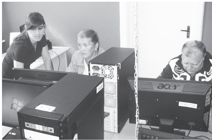
Основы компьютерных знаний необходимы и пожилым людям