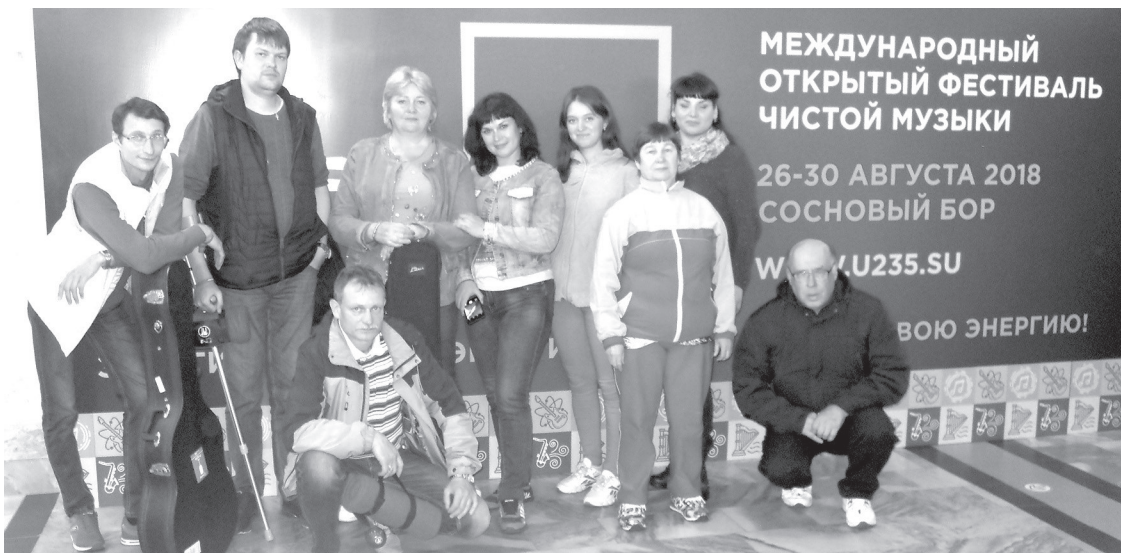
Фото делегации на память после официальной регистрации на фестивале

О. МЕЛКОЗЁРОВ