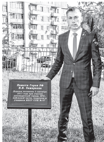
Ровно год назад в память о герое у школы были высажены деревья и установлен памятный знак