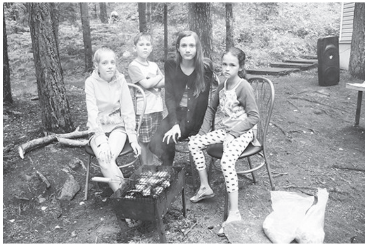
Дети любят отдых у костра, база «Таватуй»