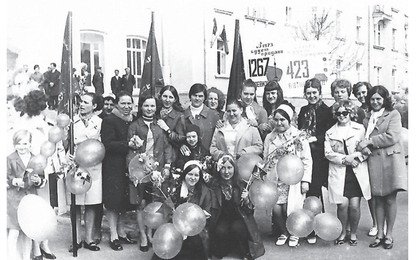
Весь коллектив первой столовой ОРСа перед Первомайской демонстрацией

Т. УФИМЦЕВА