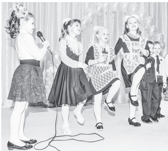
Выступают первоклассники школы № 1