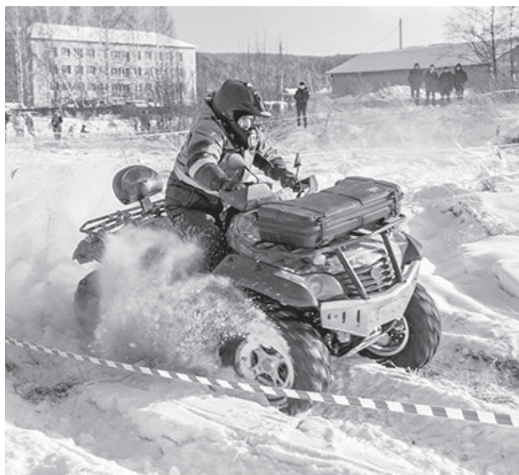
Прохождение экстремальной трассы

24 ФЕВРАЛЯ трасса на Красном Угоре принимала захватывающие соревнования по гонкам на авто-, мото- и квадроциклах «Зимагор-2018».