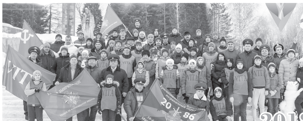
После пробега 23 февраля.

СВОЁ СОРОКАЛЕТИЕ ФИЗКУЛЬТУРНО-ОЗДОРОВИТЕЛЬНЫЙ КЛУБ «ВИТА» ОТМЕТИЛ В ПРОШЕДШЕМ ГОДУ.