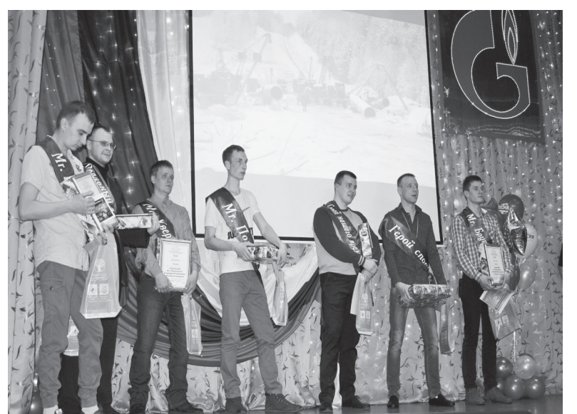
Волнения позади, с праздником, настоящие мужчины!

Каждый участник конкурса получил подарки и сертификаты от многочисленных спонсоров и партнёров ЛПУ, за что организаторы про-