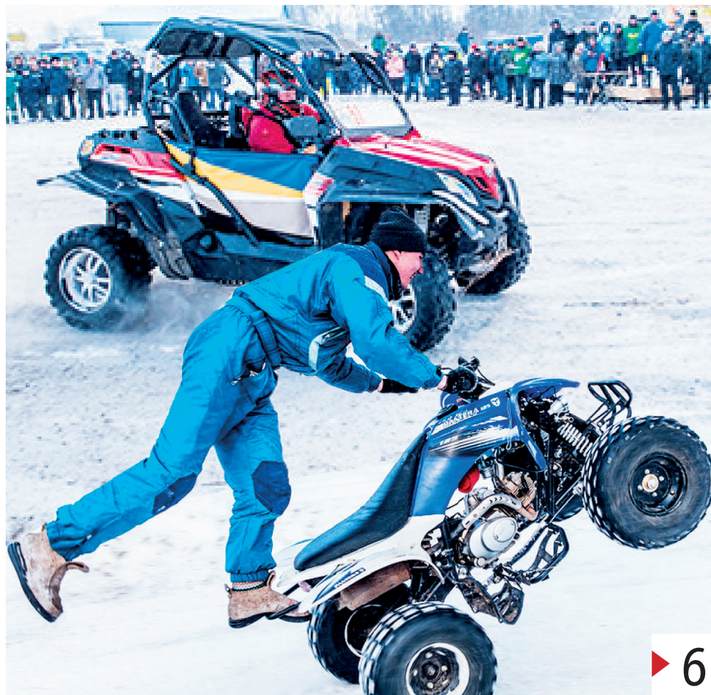
Гонщики показали высший класс!