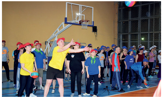
Каждая команда стремится к победе!

держке многочисленных болельщиков. Такой массовости в «Весёлых стартах» у нас ещё не было. Организаторы определили призовые места среди болельщиков. Многочисленные представители подразделений 900, 343, ОРБ получили призы от профсоюзного комитета комбината (соответственно, 1, 2, 3 места) за изобретательность и яркую активность при поддержке своих команд. А каждый участник состязания получил памятный вым-