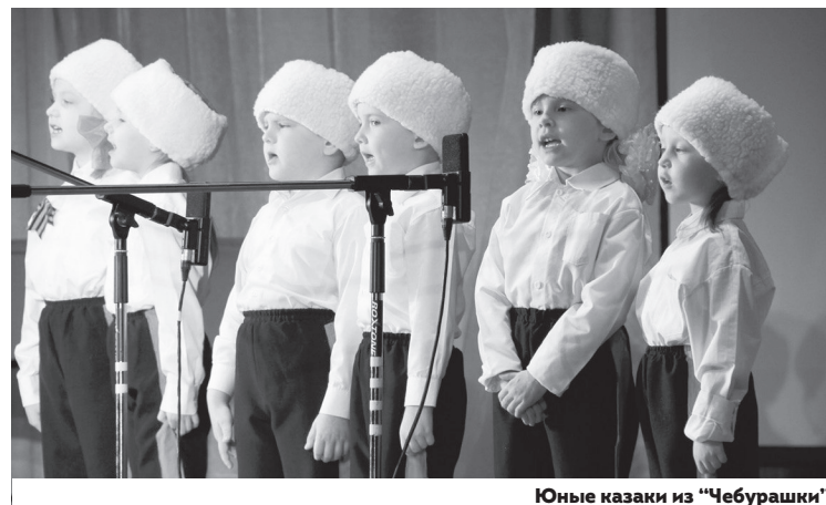
Юные казаки из «Чебурашки»