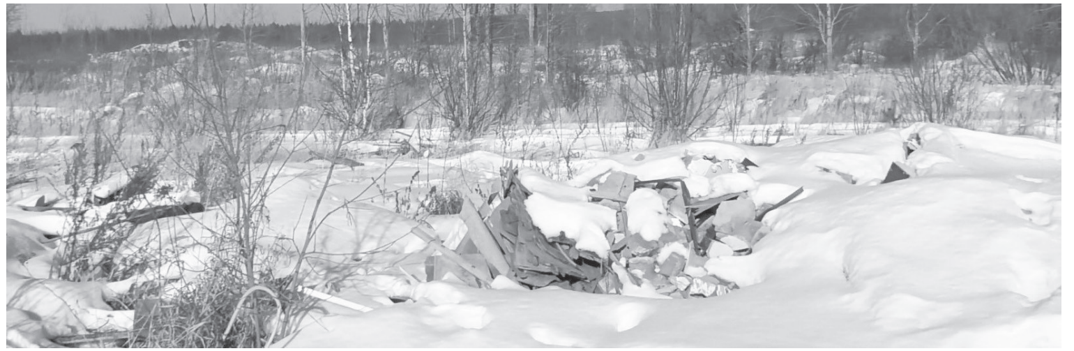
Несанкционированная свалка в районе зольного поля