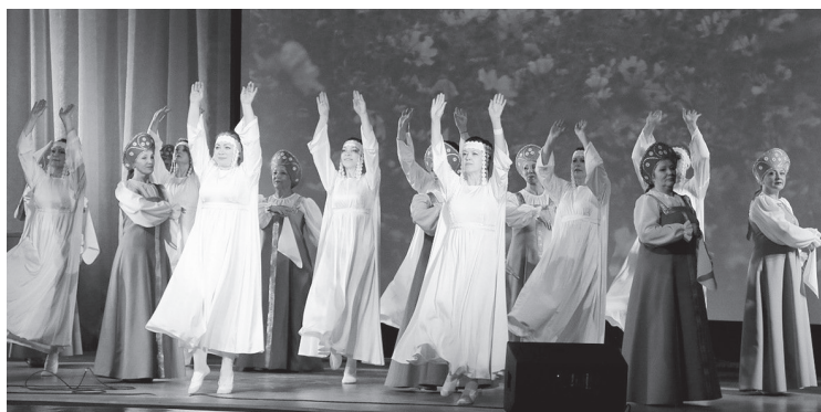
Выступает ансамбль «Малахит»