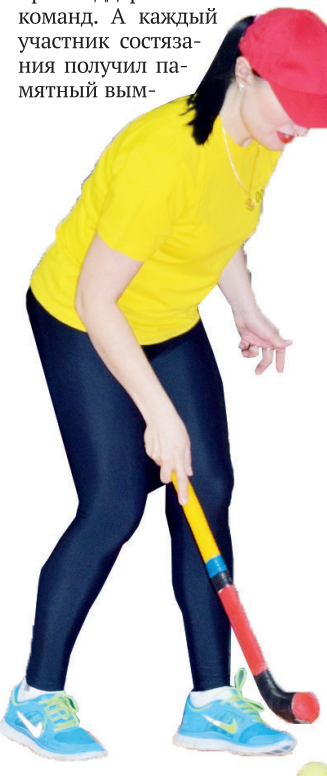
Смелее, только бы удержать мяч!