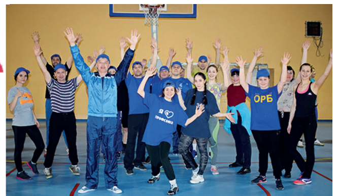
«Ура, мы - молодцы!»