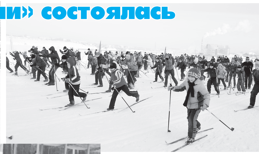
Vir-забег набирает обороты.