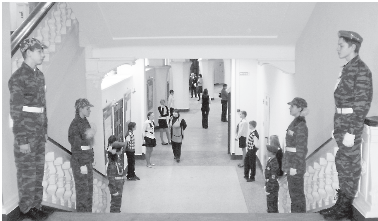
Почётный караул в окружном Доме офицеров.

депутат Палаты Представителей Законодательного Собрания Свердловской области.