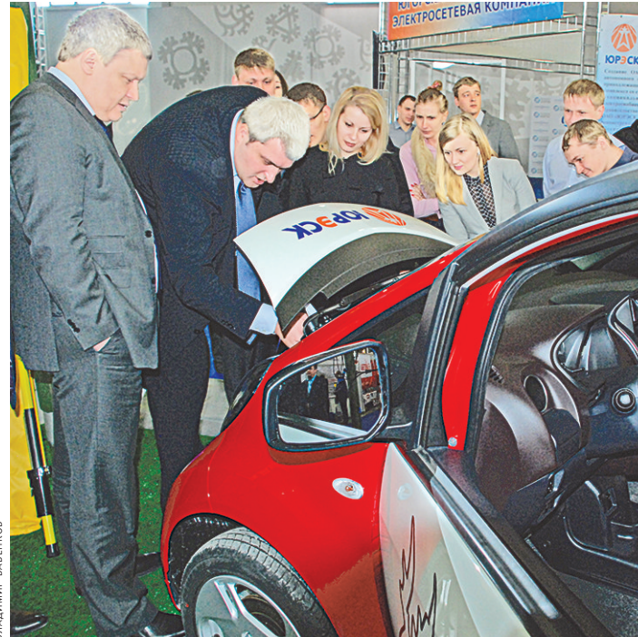
До конца текущего года в югорской столице появится десяток заправок для подобных электромобилей.