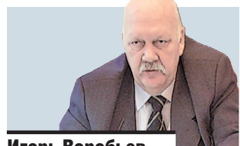
Игорь Воробьев, главный госинспектор по охране труда РФ: