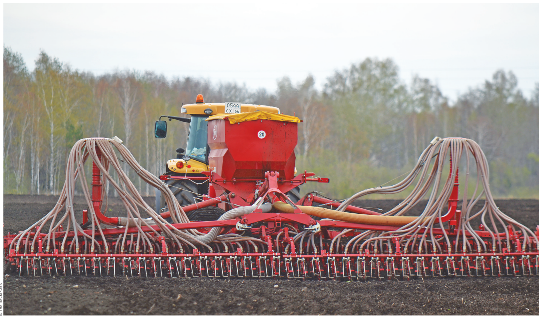
Посевная в крестьянском хозяйстве ООО «Степанов» в селе Коменки Свердловской области началась с радостного события: здесь приобрели новую сеялку белорусского производства. Обновить парк техники и реконструировать молочно-ферму хозяйству помогли частные инвесторы. Приход бизнеса в агропромышленный комплекс позволяет поднять на новый уровень материально-техническую базу хозяйств и способствует возрождению уральской деревни.

Посевная здесь пока в самом разгаре. Выращивают главным образом кормовые культуры, чтобы обеспечить молочно-ферму, в которой уже около 800 голов скота. Коменки объясняют: почти всю продукцию комбинированного завода в Богдановиче приобретает крупнейший местный свинопроизводитель, мелким сельхозпроизводителям мало что