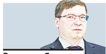
Владимир Якушев, губернатор Тюменской области.