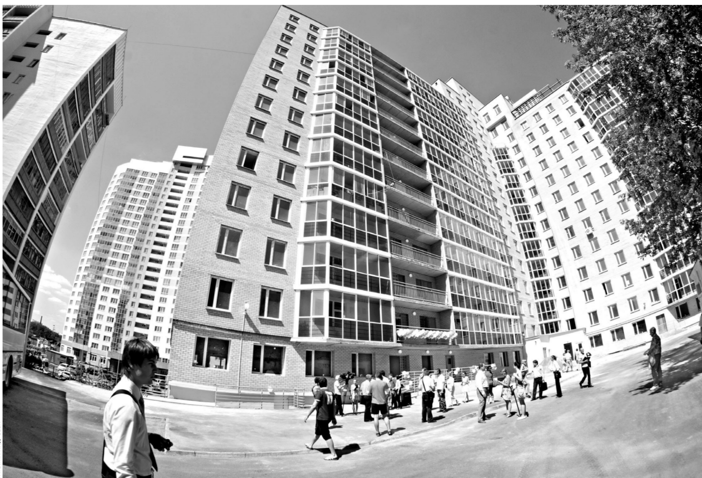
В Екатеринбурге сдан очередной проблемный дом. Строительство многоэтажки началось еще в 2005 году, квартиры в нем рассчитывали получить 137 семей, вложивших деньги в долевое строительство. Но застройщик не выполнил свои обязательства, и в 2008 году стройка была заморожена. Благодаря принятию регионального закона в Свердловской области удалось решить проблему обманутых дольщиков: сегодня осталось завершить лишь 12 долгостроев. Практически все эти дома, по заверению властей, будут сданы до конца 2013 года.