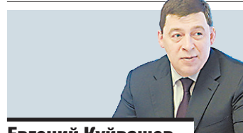
Евгений Куйвашев, губернатор Свердловской области.