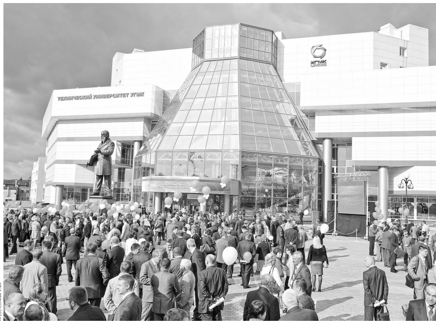
В Верхней Пышме открылся Технический университет Уральской горно-металлургической компании. В реализации проекта также приняли участие представители Свердловской области и Уральского федерального университета. Новый корпоративный вуз ориентирован на практическую подготовку персонала для УГМК и других предприятий металлургического профиля — порядка 12 тысяч человек в год. Его слушателями станут руководители, специалисты предприятий холдинга, а также студенты, обучающиеся по целевому набору. Кроме того, в специализированных классах будут готовить высококвалифицированных рабочих. Общая стоимость проекта превысила 1,3 миллиарда рублей.