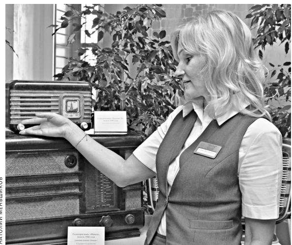
Ретро-электроника привлекла особое внимание посетителей выставки.

А в областной научной библиотеке в рамках форума организована необычная экспозиция: посетители знакомятся с образами передовых технологий успешных времен. Французский фonoграф системы Пате и телефонный аппарат «Эриксон» конца XIX века, радиоприемники и первый массовый советский телевизор КВН-49 середины прошлого века, отечественный монитор и компьютер 35-летней давности — есть с чем сравнить.