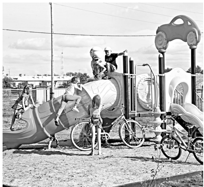
Жители села сами решают, на что потратить собранные деньги — отремонтировать дорогу или построить детскую площадку.