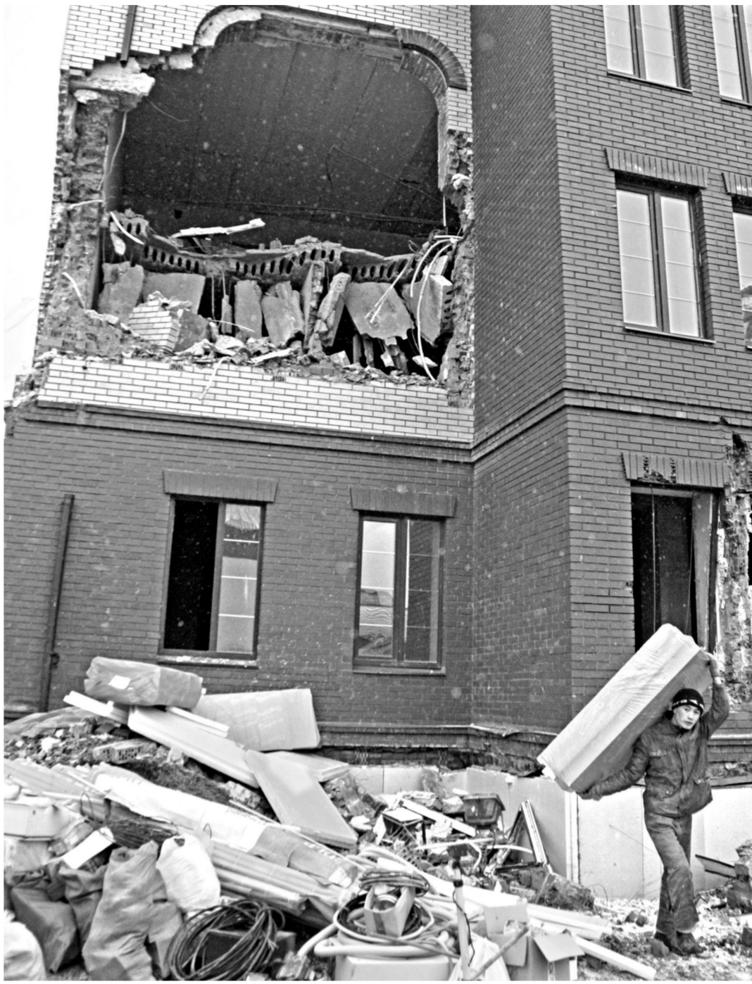
Даже если удастся найти деньги на снос незаконно возведенного строения, не так-то просто потом взыскать их с собственника.