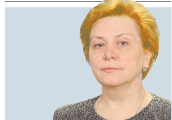
Наталья Комарова, губернатор Югры