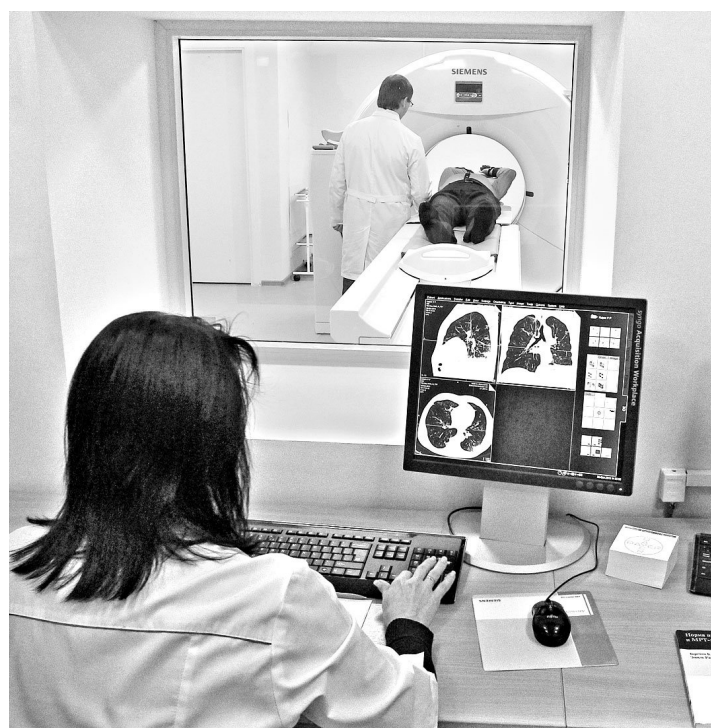
В Челябинской областной клинической больнице № 4 появилось немало нового оборудования, в том числе современной томограф.

рублей получила Челябинская область по программе модернизации здравоохранения с 2011 года