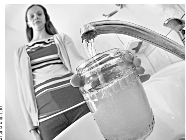
В некоторых муниципальных образованиях более половины проб воды не соответствуют нормативам.

803 СИСТЕМЫ централизованного хозяйственного водоснабжения насчитывается на Южном Урале