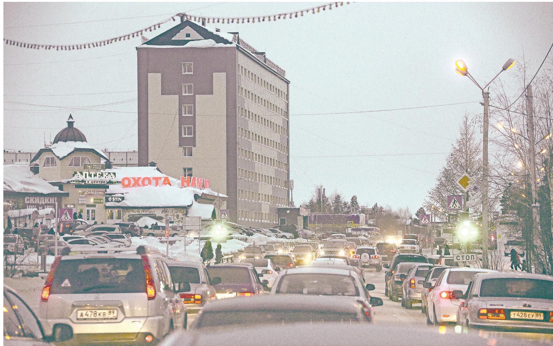
Анатолий Горлов, Екатеринбург

Каждое утро почти треть времени на дороге от дома до работы я тратю на пересечение всего одного перекрестка — восторженной улицы Шварца с главной, Белинского. На главной, игнорируя светофор и возмущенные сигналы водителей, которым горит зеленый, полустойт-полудвигается армия машин. Этот нескончаемый железный поток, прибывающий из предместий Екатеринбурга, — один из тех, что каждое утро вливается в город с четырех сторон. С каждого направления, по данным мэрии, — более 40 тысяч автомобилей.