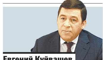
Евгений Куйвашев, губернатор Свердловской области.