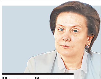
Наталья Комарова губернатор Югры