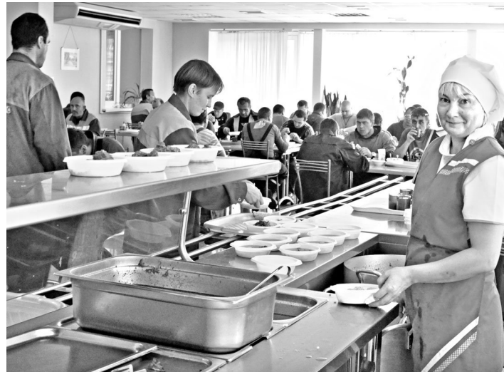
Бесплатно кормят работников уже десятки предприятий Тюменской области.