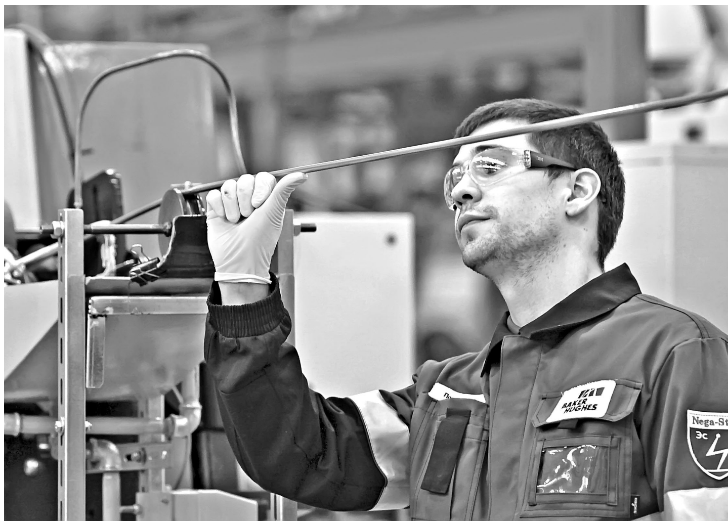
В Тюмени открылся первый в России завод международной компании, который будет производить нефтепогружной кабель для добывающих предприятий Западной Сибири. Мощность производства — 4000 километров кабеля в год. Строительство второй очереди позволит увеличить объем вдвое и начать поставки продукции на экспорт. Проект обошелся почти в 2 миллиарда рублей. Тюмень выбрана инвестором не случайно: решающую роль сыграли близость к потребителям и поддержка со стороны региональных властей. Городу это даст 200 рабочих мест. Кстати, в ближайшем полугода в области будет запущено еще шесть масштабных промышленных производств, в том числе четыре — с участием иностранного капитала.

— Родители идею поддержали, но трудности возникли с поиском инвесторов, готовых помочь в формировании начального ка-