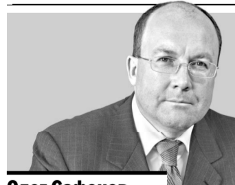
Олег Сафонов вице-президент Ростуризма