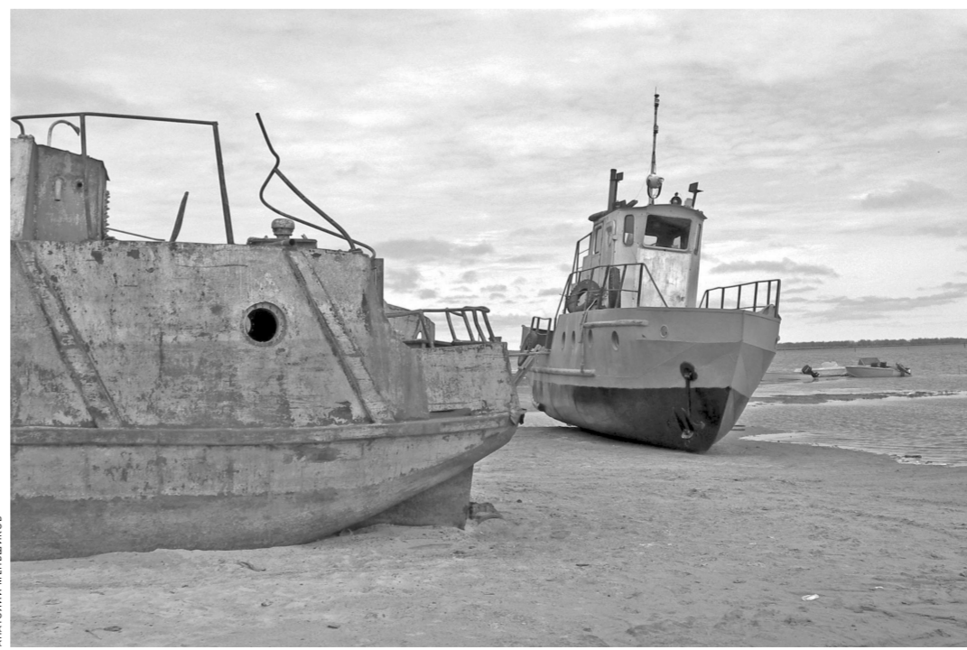
В окрестностях Сургута покоятся на дне и берегах два десятка ржавых судов.

А ведь случается отправка в рейс заведомо негодных к эксплуатации судов. Меня заинтересовала история расследования межре-