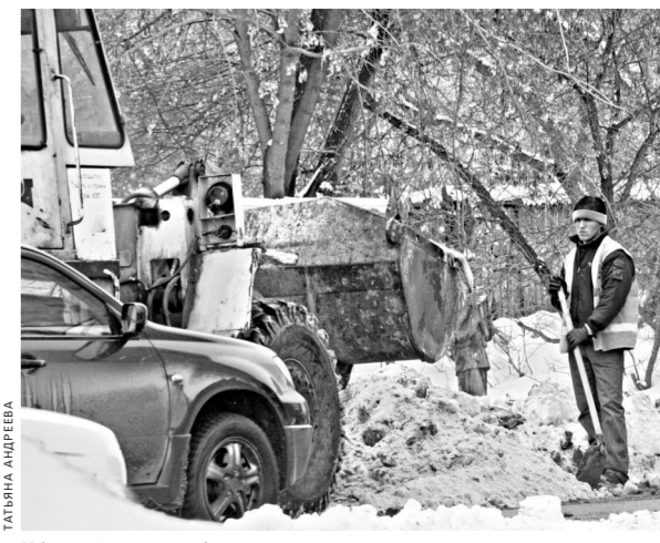
Местные дороги в большинстве регионов занимают не МУПы, а частные компании, победившие в конкурсах на оказание муниципальных услуг.

— Не вижу смысла передавать на аутсорсинг функции заказчика по обеспечению дорожных работ местного значения. Мы свои обязательства выполняем в полном объеме. Многие муниципалитеты работают по сметам, а мы на каждый объект заказываем проект, привлекаем сторонние организации для принятия выполненных работ. Конечно, никто не застрахован от недобросовестных подрядчиков, в случае выявления нарушений надо действовать в соответствии с законом. К слову, три специалиста у нас уже прошли курс обучения по новому закону о контрактной системе в сфере госзакупок, получили удостоверения, так что справимся.