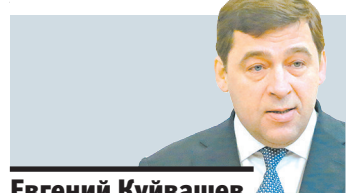
Евгений Куйавшов губернатор Свердловской области