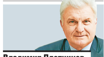
Владимир Плотников член Совета Федерации, президент АККОР