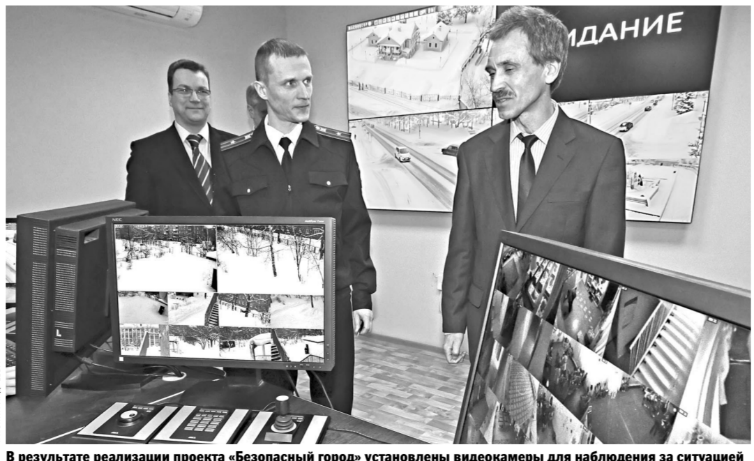
В результате реализации проекта «Безопасный город» установлены видеокamеры для наблюдения за ситуацией на улицах, в детских садах и школах.

В прошлом году администрации Нижнего Тагила удалось сэкономить 157 миллионов рублей благодаря проведению конкурсных торгов и использованию более эффективных конструктивных решений — эти деньги вернули в бюджет области.