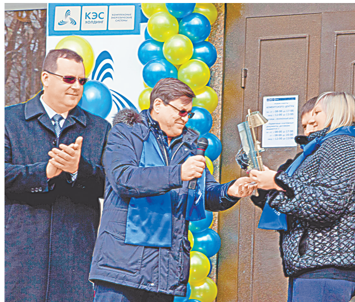
Открытие клиентского центра сделает процесс взаимодействия потребителей с поставщиком тепла максимально удобным.

Отметим, что в последние годы платежная дисциплина потребителей Свердловской теплоэнергетической компании в Екатеринбурге улучшилась: 86 процентов счетов за тепло и горячую воду стабильно оплачиваются в срок. Среди основных должников — лишь три управляющие компании. Но их суммарный долг превышает 500 миллионов рублей.