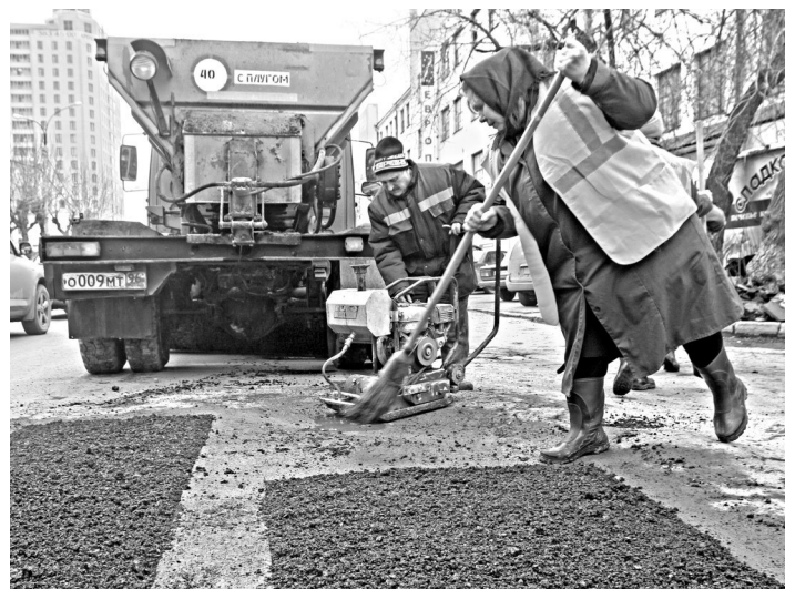
В этом году власти Екатеринбурга приняли беспрецедентное решение: ямочный ремонт начнется почти на месяц раньше обычного срока.

— Это лишь вопрос денег. В зависимости от суммы можно рекомендовать тот или иной материал. Но из администрации Екатеринбурга никто к нам за советом или консультацией не обращался, — сообщили в институте.