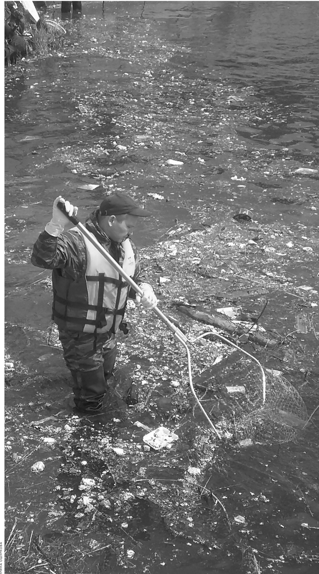
Работникам МУПа приходится не только вручную сачками вылавливать мусор, но и собирать нефтяные пятна с поверхности воды.

В бригаде работают всего 3–6 человек. Надо сказать, что после озвучивания суммы контракта горожане начали считать, сколько получит каждый работник. В соцсетях появились ехидные комментарии: «Сачки не золотые, случаем?», «Не каждый день мусорщики по 300 тысяч получают!». На самом деле в статье расходов, помимо зарплат, — топливо для моторки, затраты на перевозку мусора до полигона. К слову, и сачки действительно «золотые» — каждый стоит порядка тысячи рублей. А еще требуются сапоги, перчатки, пакеты, спасательные жилеты... В один из предыдущих сезонов насобирали два КамАЗа старых покрышек — ни одна свалка не возьмет такие отходы на захоронение, пришлось искать предприятие, занимающееся их утилизацией. Раза два-три за сезон приходится нанимать аквалангистов — они помогают извлекать крупногабаритный мусор на глубину. Словом, работа на воде хитрая и непыльная в прямом смысле слова, но малоприятная и хлопотная. Да и сверхдоходов в этом бизнесе не получишь.