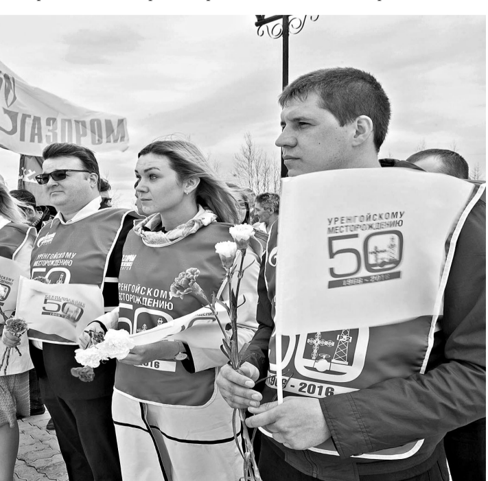
Молодые газодобытчики готовы принять у ветеранов трудовую эстафету и хранить традиции предприятия.