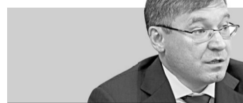
Владимир Якушев губернатор Тюменской области