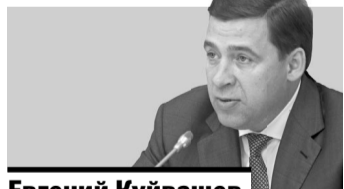
Евгений Куйвашев губернатор Свердловской области