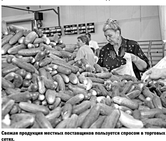
Свежая продукция местных поставщиков пользуется спросом в торговых сетях.

— Комиссия перенесла рассмотрение дела — отложила еще на месяц. В связи с изменениями законодательства и вступлением в силу с 5 января 2016 года так называемого четвертого антимонопольного пакета, прежде чем выносить окончательное решение по делу, необходимо ознакомить обе стороны с заключением комиссии,