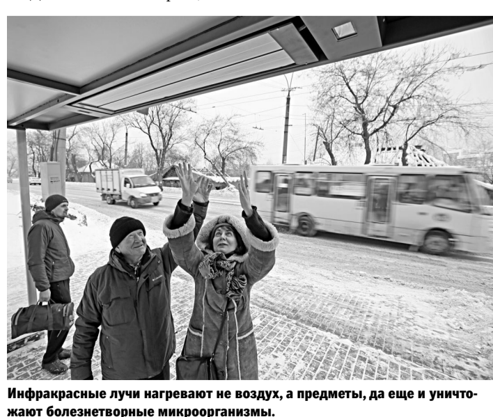
Инфракрасные лучи нагревают не воздух, а предметы, да еще и уничтожают болезнетворные микроорганизмы.