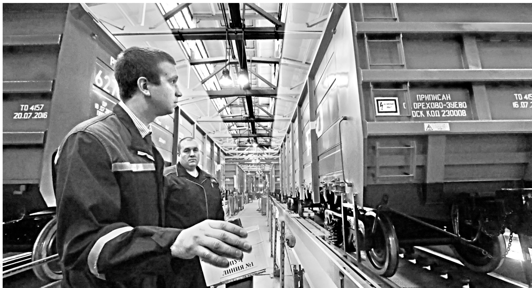
Одно из крупнейших на Среднем Урале предприятий отпраздновало 80-летие торжественной передачей 10-тысячного полувагона, произведенного на заводе, профильной железнодорожной компании. На федеральном и региональном уровнях оказывается существенная поддержка по многим направлениям, в том числе по расширению экспортных поставок как оборонной, так и гражданской продукции, в число которой входят полувагоны.

Отметим, в Свердловской области это первый случай такого давления на покупателей — во всяком случае, ставший достоянием гласности.