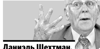
Даниэль Шехтман, лауреат Нобелевской премии-2011 (Израиль)