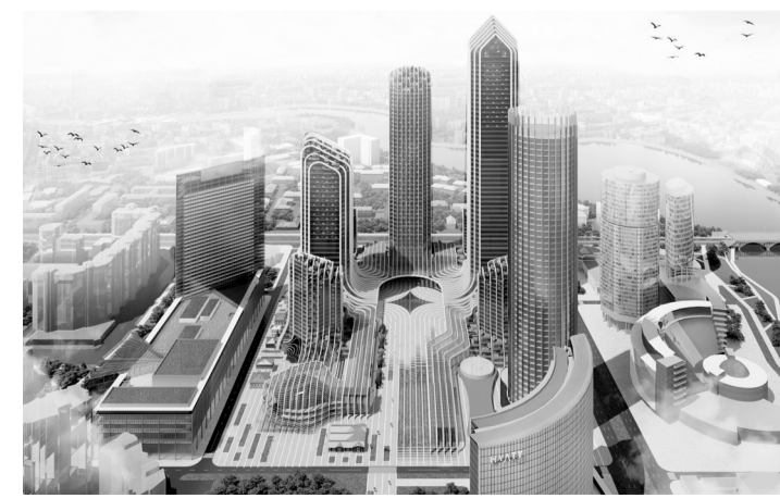
Петербургские архитекторы из института «Горпроект» представили Екатеринбург-сити похожим на Рокфеллер-центр в Нью-Йорке.

Приз зрительских симпатий вручили проекту из Перми. За него проголосовало свыше тысячи пользователей Интернета, а всего в голосовании приняло участие четыре тысячи человек. Изюминка этого замысла — новая городская площадь, на которой можно проводить массовые праздники так, чтобы это не раздражало жителей окрестных домов. А также второй высотный кластер, для чего придется не только зарезервировать землю на противоположной стороне улицы Челюскинцев, но и организовать подземный пешеходный переход.