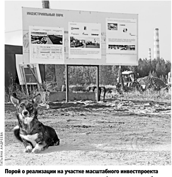
Порой о реализации на участке масштабного инвестпроекта говорит лишь установленная на нем информационная табличка.