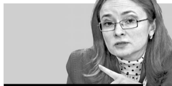
Эльвира Набиуллина , председатель Банка России