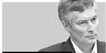
Евгений Ройзман, глава Екатеринбургa