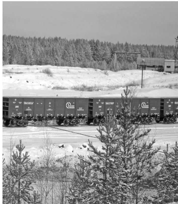
В условиях определенного дефицита подвижного состава выиграли грузоотправители, которые работают с оператором на условиях долгосрочных сервисных контрактов.

По мнению общественников, это реальный и, пожалуй, единственно возможный вариант выхода из ситуации.