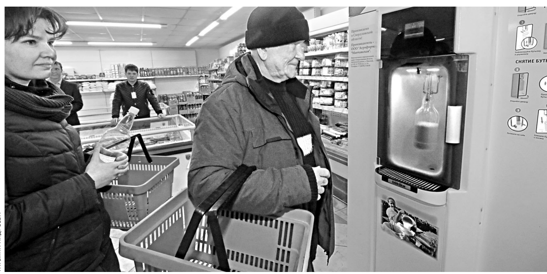
От утренней дойки до установки бочки в молокомаст проходит 4–8 часов.

составил рост внебюджетных доходов вузов-участников 5–100 за три года реализации проекта.