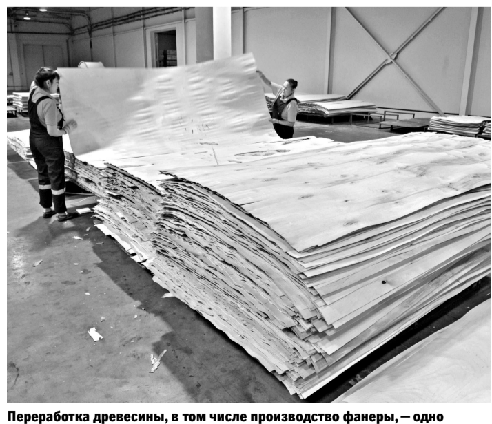
Переработка древесины, в том числе производство фанеры, — одно из перспективных направлений развития бизнеса в Тюменской области.