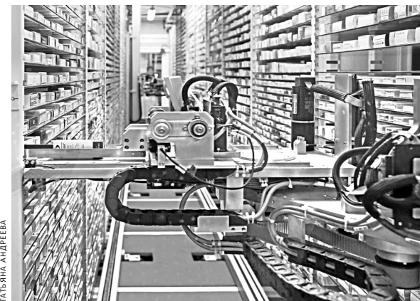
От того, по каким ценам закупает медикаменты областной склад, зависят и расценки в розничной аптечной сети.