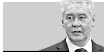
Сергей Собянин, мэр Москвы