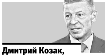
Дмитрий Козак, заместитель председателя правительства РФ