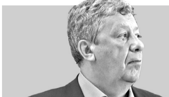
Аркадий Чернецкий, член Совета Федерации