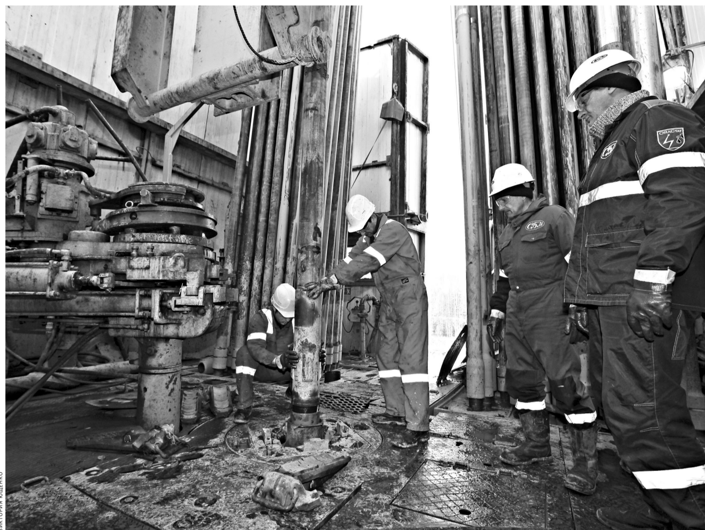
Традиционные методы нефтедобычи скоро могут уйти в прошлое.