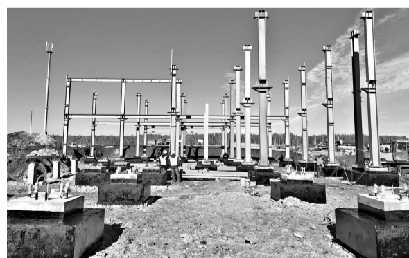
На стройплощадке Томинского ГОКа полным ходом идет работа.

Томинский ГОК (входит в Русскую медную компанию) приступил к возведению главного корпуса обогатительной фабрики и других капитальных объектов в Сосновском районе Челябинской области. К концу 2019 года планируется построить 17 зданий. Сейчас на стройплощадке задействовано 200 человек и 45 единиц техники. На июль 2017 года инвестиции в проект оцениваются более чем в 65 миллиардов рублей, это будет самый масштабный и современный комбинат в отрасли. Инновационные технологии позволяют обогащать медно-порфиуровую руду с содержанием меди всего 0,4 процента. На будущее предприятие планирует внедрить стандарт «Умная медь», который предполагает максимально эффективное, высокотехнологичное и экологически безопасное производство.