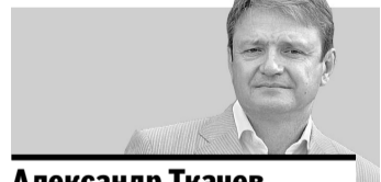
Александр Ткачев, министр сельского хозяйства РФ