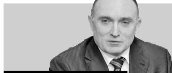
Борис Дубровский, губернатор Челябинской области