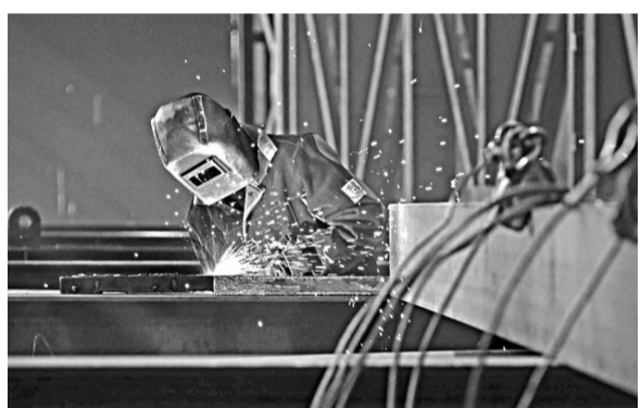
В сварочном цехе Уралмашзавода в настоящее время идет резка металла для кранов эстакады АЭС «Кулангулам».

Уралмашзавод приступил к изготовлению оборудования для третьего и четвертого энергоблоков АЭС «Кулангулам» (Индия). В рамках участия в крупнейшем российско-индийском проекте предприятие произведет два крана эстакады, две перегрузочные машины и детали шлюзов для персонала четвертого энергоблока. Краны будут использоваться для выполнения подъемно-транспортных операций при строительстве станции, а затем для доставки грузов, в том числе опасных, в область транспортного шлюза перед реакторным залом. Первые два блока станции, которые обеспечивают электроэнергией юг Индии, также оснащены оборудованием с маркой УЗТМ.