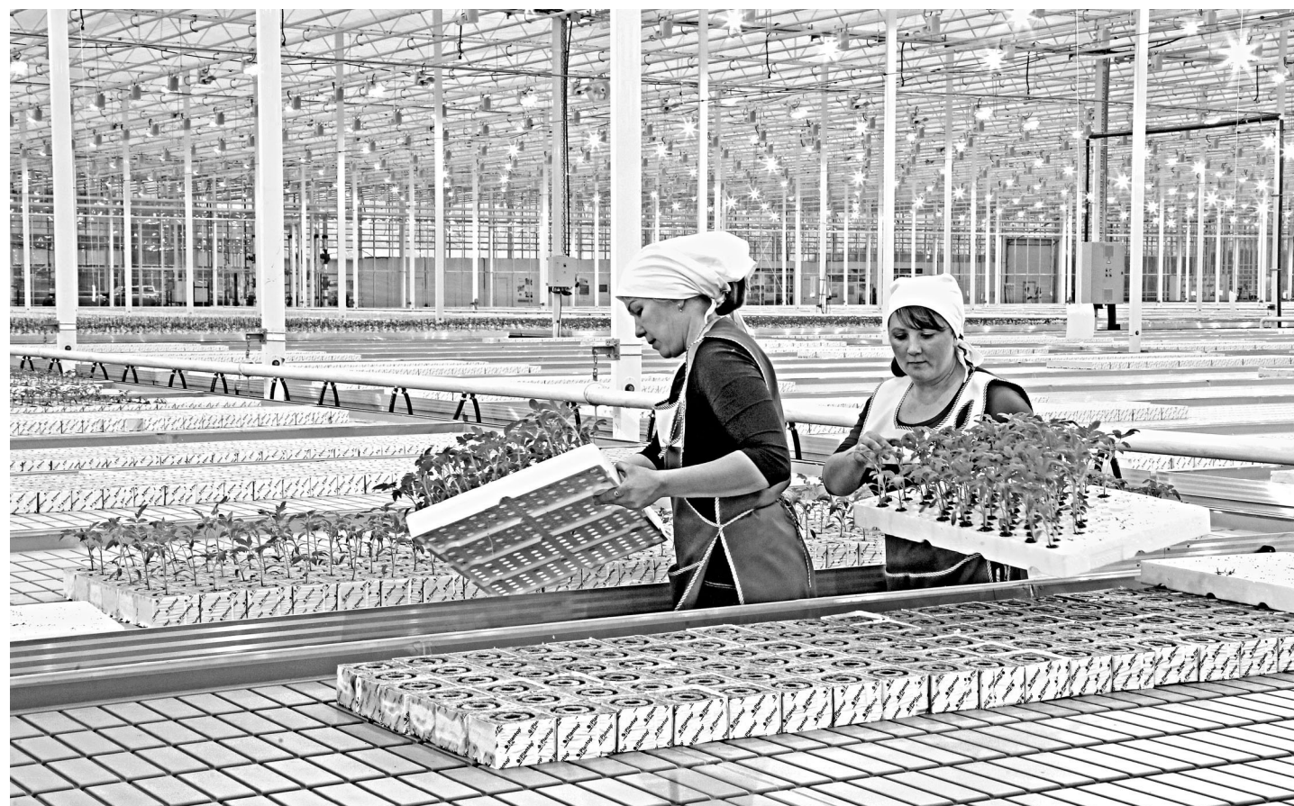
Аграрное подразделение горно-металлургического холдинга построило под Екатеринбургом инновационный тепличный комплекс площадью 17,64 гектара. Реализация инвестпроекта началась в прошлом году. Теплицы оснащены уникальной климатической системой, автоматизированными системами управления минеральным питанием и микроклиматом. Комбинат получает электричество от собственного энергоцентра, что дает значительный экономический эффект. Общая сумма инвестиций в проект — 5,3 миллиарда рублей, почти треть субсидировало государство. Строительство второй очереди комбината в 2018 году позволит хозяйству наполовину обеспечить потребности региона в овощах закрытого грунта.