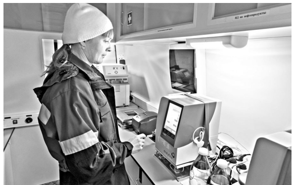
В мобильных лабораториях эксперты исследовали качество бензина с помощью высокоточных приборов.

Во Всемирный день качества сеть АЗС «Газпромнефть» провела межрегиональную акцию по открытой проверке качества моторного топлива «Топливный класс». Челябинск, Екатеринбург и Тюмень вошли в число девяти территорий, где все желающие могли бесплатно протестировать бензин и дизельное топливо в мобильных лабораториях «Газпромнефть». За время проведения акции автолюбители предоставили на исследование более 100 проб. С помощью высокоточных экспресс-анализаторов и стандартизованных автоматических приборов эксперты проводили физико-химический анализ топлива по всем основным параметрам: октановому числу бензина, массовой доле серы, фракционному составу, содержанию бензола и другим. В среднем в ходе проверки почти в 40 процентах проб было зафиксировано отклонение от норм технического регламента Таможенного союза. Лидером по количеству проведенных исследований среди всех регионов стал Урал. При этом здесь эксперты забраковали около половины проб. Опрос участников акции показал: некачественный бензин в большинстве случаев приобретался на независимых заправках.