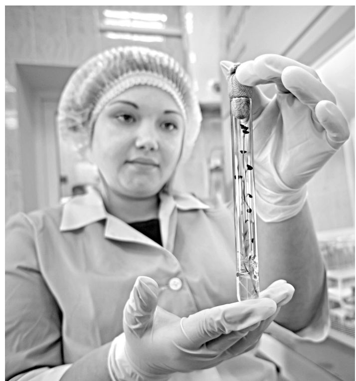
Центр еще не достроен, но работа в лабораториях уже началась: пока микрорастения живут в пробирках.

ем две лаборатории — микроклонирования и диагностики, а также шесть теплиц. До полномасштабного запуска центра предстоит возвести еще два хранилища: одно для суперэлита, второе — для элитных семян. Для начала в лаборатории центра из Московского института картофелеводства имени Лорха завезли культуру инвитро — 800 пробирок. К апрелю 2018 года из них получат 50 тысяч абсолютных здоровых безвирусных микро-растений для высадки в теплицу. Когда центр выйдет на проектную мощность, будет производить 10 тысяч тонн качественного посадочного материала. Этого количества хватит, чтобы удовлетворить потребности в семенном картофеле аграриев и Среднего Урала, и соседних регионов.