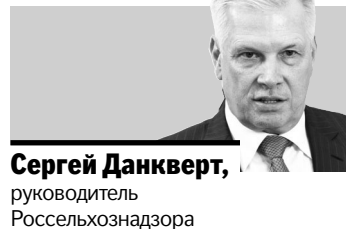
Сергей Данкверт, руководитель Россыельхознадзора