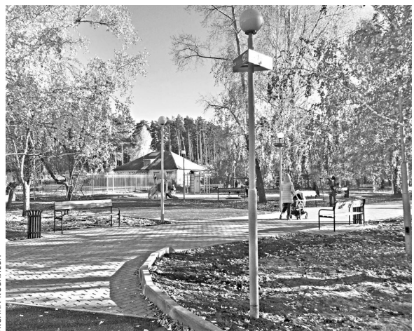
В Кетовском парке есть не только дорожки для прогулок и удобные скамейки, но и свободный Wi-Fi.

На самом деле не так важен сам по себе проект, как его концепция. Сначала нужно придумать, как привлечь людей, кому и что это даст, а потом запускать программу. В разработке концепции должны участвовать жители, только тогда будет толк. Кстати, по рекомендациям Минстроя РФ, с нового года все проекты благоустройства должны проходить обязательное общественное обсуждение. Возможно, это что-то изменит в формировании программы на следующий год.