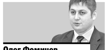
Олег Фомичев, заместитель министра экономического развития РФ