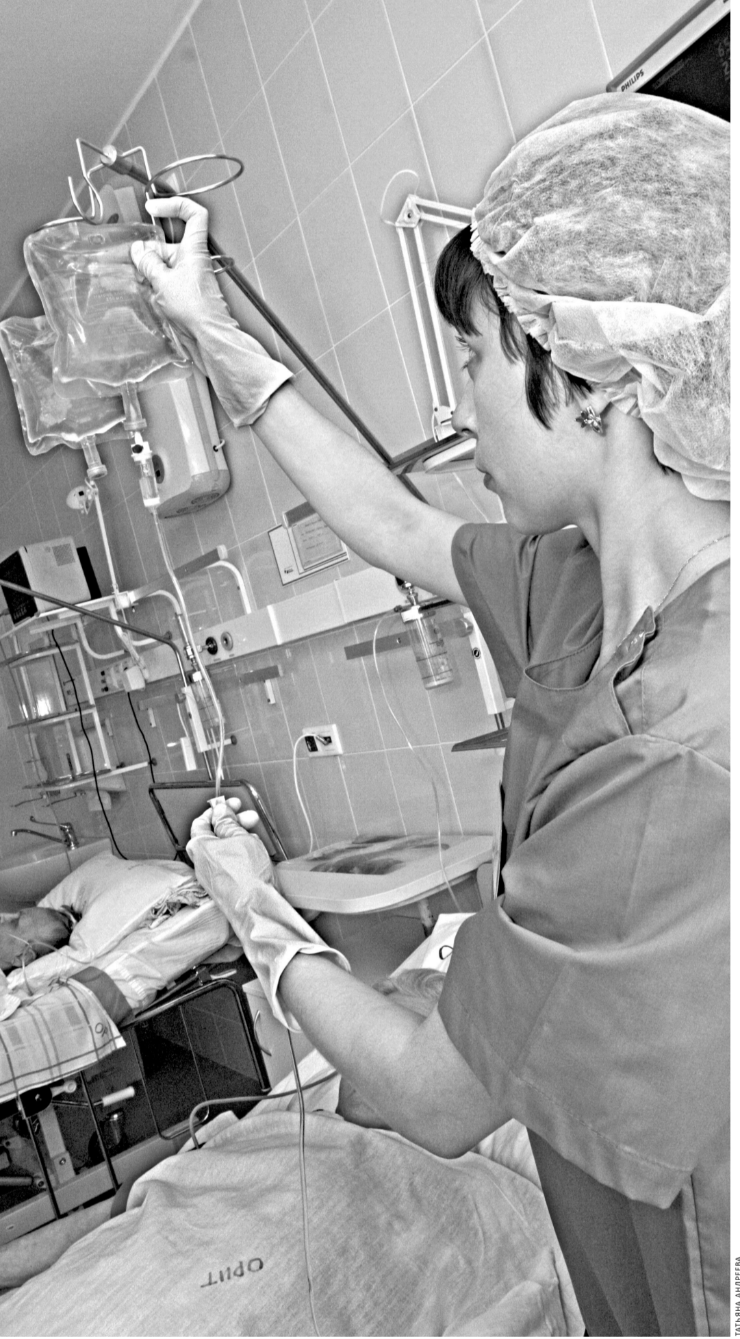
Если бы махинация поставщика не вскрылась, сотни пациенток онкодиспансера могли бы получить капельницы с настоящим ядом.

— Можно было, конечно, сначала дожидаться поставки, потом взять из партии несколько образцов и отправить их на экспертизу, доказать, что они потеряли свою эффективность из-за неправильного хранения. Но в таком случае пришлось бы за-