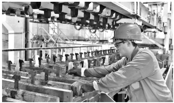
Вес одного свинцово-серебряного анода — 275 килограммов, площадь — 3,9 квадратного метра. Всего в ванне находится 81 анод, которые кран переносит в машину за четыре подъема.

В рамках программы реконструкции производства Челябинского цинкового завода в цехе «Комплекс электролиза цинка» введена в эксплуатацию анодно-правильная машина. Стоимость оборудования канадского производителя составила 1,2 миллиона евро. Основная продукция завода — цинк чистотой 99,995 процента, получаемый в процессе электролиза. Чем чище и ровнее поверхность анода, тем лучше протекает процесс и тем качественнее конечный продукт. Поэтому аноды необходимо чистить и выпрямлять каждые 20–40 дней. Именно для этого и используется анодно-правильная машина. Старая машина могла править 400 анодов в сутки, новая — 830.