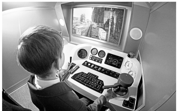
На ДЖД в Екатеринбурге десятки лет готовят будущих железнодорожников.

На базе Свердловской детской железной дороги (ДЖД) открывается образовательный технопарк «Кванториум» — с 1 июня начинается прием заявок. Школьники в возрасте от 11 до 17 лет смогут пройти здесь обучение по актуальным направлениям: промышленный дизайн, высокие и информационные технологии, дополненная и виртуальная реальность. Сеть образовательных технопарков «Кванториум» в регионе создается в рамках соглашения, подписанного между Свердловской железной дорогой (СЖД) и Дворцом молодежи. Идея кванториумов предусматривает создание единой системы выявления талантливых детей, развитие детского творчества и научно-исследовательской деятельности, формирование интереса к техническим профессиям. Детская железная дорога — уникальный центр профориентации с большим опытом работы и прекрасной материально-технической базой. Руководители СЖД отмечают, что создание «Кванториума» на площадке ДЖД — инвестиция в будущее как для Свердловской магистрали, так и для региона в целом. В технопарке смогут заниматься не только юные железнодорожники, но и другие школьники.