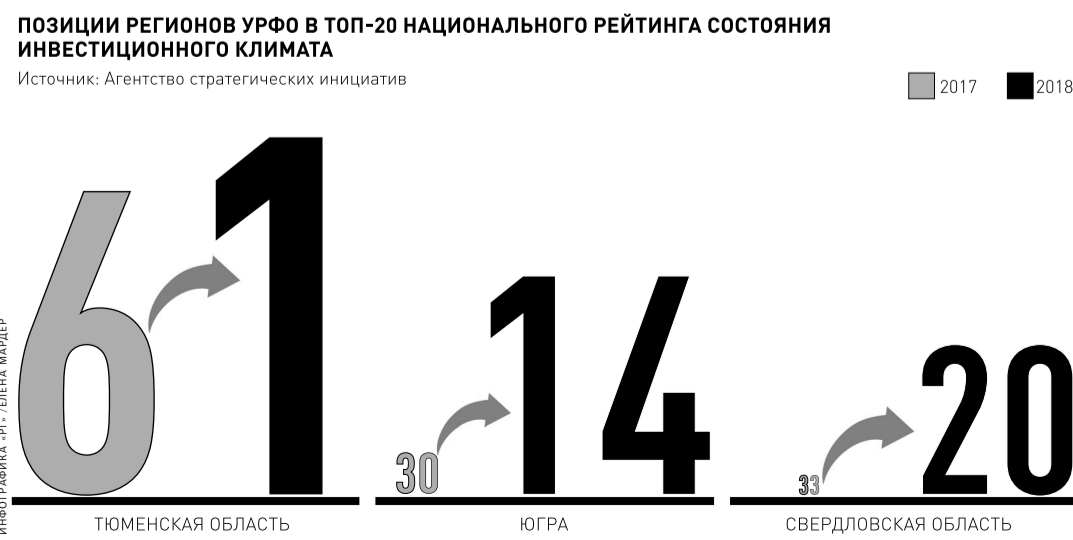
Иллюстрация: АГ. ЕЛЕНА МАКЕЕВА

ЕКАТЕРИНБУРГ: ул. Тургенева, 13, офис 820. Телефон/факс (343) 371-24-84, 350-30-68. E-mail: san@rg-ural.ru ТЮМЕНЬ: ул. Осменко, 81, офис 1004. Телефон/факс: (3452) 35-24-94, 35-25-11. E-mail: man72@mail.ru ЧЕЛЯБИНСК: Свердловский пр., 60. Телефон/факс: (351) 727-73-33, 727-78-08. E-mail: chel@rg.ru