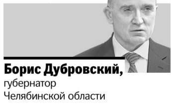
Борис Дубровский, губернатор Челябинской области