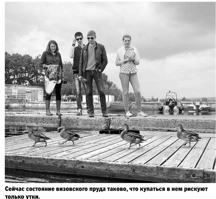
Сейчас состояние визовского пруда таково, что купаться в нем рискуют только утки.

Уже в августе станет известен объем отложений, скопившихся в обоих водоемах, и определен срок, в течение которого их планируется удалить. Кроме того, специалисты высчитают стоимость очистки.