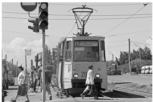
Сегодня в Челябинске большинство трамваев изношено почти на 90 процентов.

Усть-Катавский вагоностроительный завод, входящий в Объединенную ракетно-космическую корпорацию (структура Роскосмоса), может стать поставщиком трамваев для южноуральских городов. В преддверии саммитов ШОС и БРИКС в 2020 году, а также с учетом значительного изменившегося пассажиропотоков в регионе планируют комплексную модернизацию общественного транспорта крупнейших городов — Челябинска, Златоуста и Магнитогорска. По мнению властей, формирование новой транспортной модели и модернизация парка позволят трамваям занять в пассажирских перевозках долю около 35 процентов (сейчас у них лишь 14). В 2018–2020 годах потребность области в новых трамваях составит порядка 400 единиц. Такой заказ позволит обеспечить развитие предприятия и моногорода. Завод будет поставлять вагоны на условиях контракта жизненного цикла с полнымценным сервисным обслуживанием в течение всего периода эксплуатации.