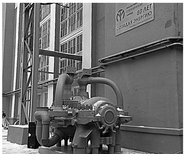
Самой массовой турбине производства УТЗ памятник поставлен вполне заслуженно.

На Уральском турбинном заводе (УТЗ), отметившем на днях 80-летие, открыли памятник легендарной «сотке»—турбине Т-100, самой массовой продукции предприятия. На постамент установлен цилиндр высокого давления—один из основных узлов реальной паровой турбины, проработавшей на Уфимской ТЭЦ-2 более 40 лет. Всего на предприятии произведено 246 турбин семейства Т-100, введенных в разные годы на станциях 11 стран. На момент создания «сотка» была одной из самых экономичных и эффективных теплофикационных турбин в мире. До сих пор большинство российских городов обогревается и обеспечивается энергией, выработанной с помощью уральской машины.