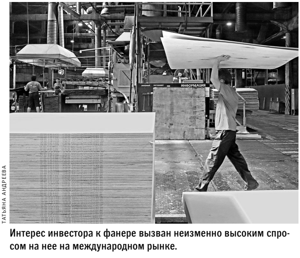
Интерес инвестора к фанере вызван неизменно высоким спросом на нее на международном рынке.